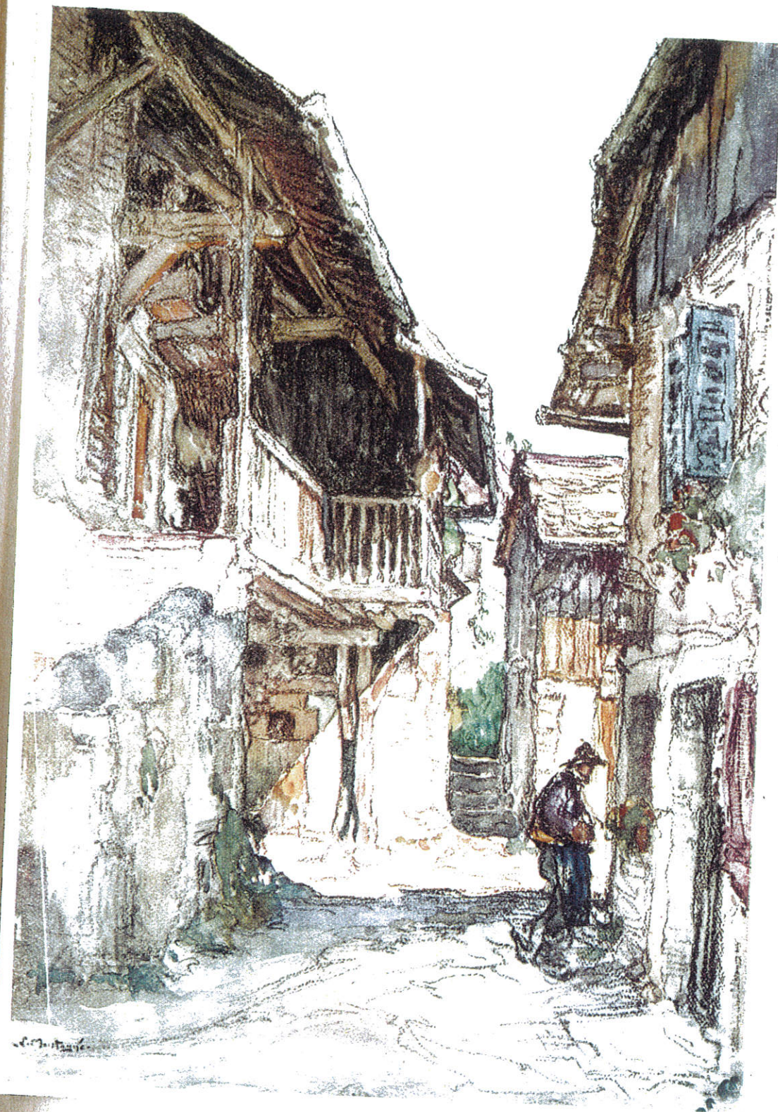
MAISONS SAVOISIENNES A CHAMBERY PAR LOUIS MONTAGNE