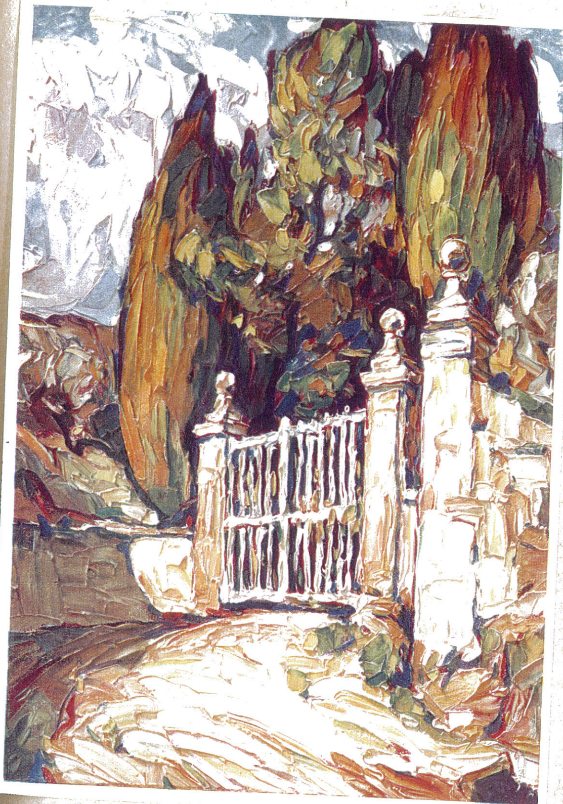
PORTAIL DE MAS A AIX-EN-PROVENCE PAR L. PASTOUR