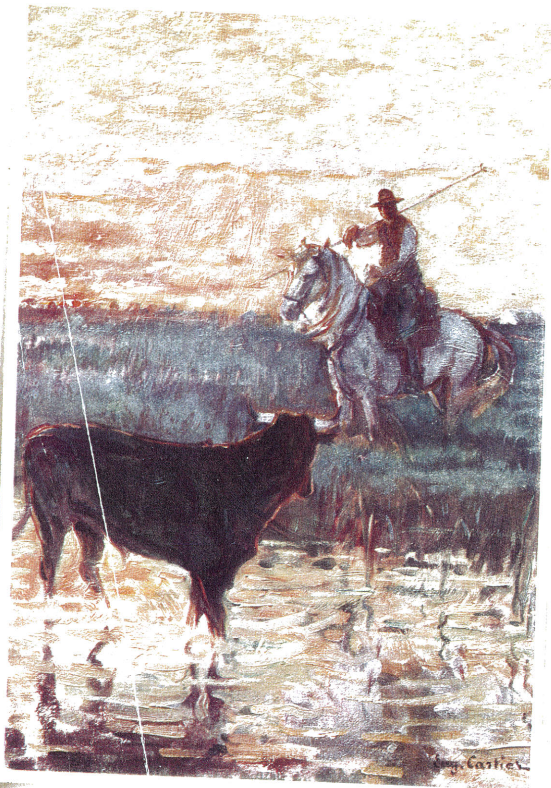
GARDIENS RALLIANT LA MANADE PAR EUGÈNE CARTIER