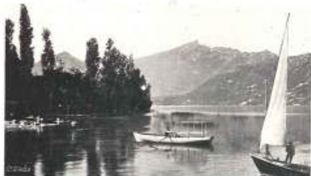
LAC DU BOURGET