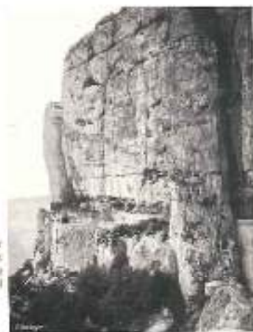
Fort de LENTE route de Combe-Laval