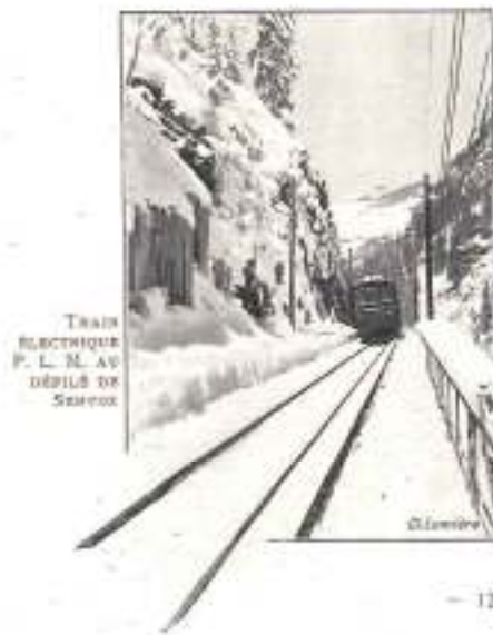
TRAIN ÉLECTRIQUE P. L. M. AU DÉPART DE SERVOZ