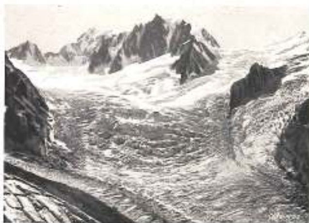
GLACIER DU GRANY