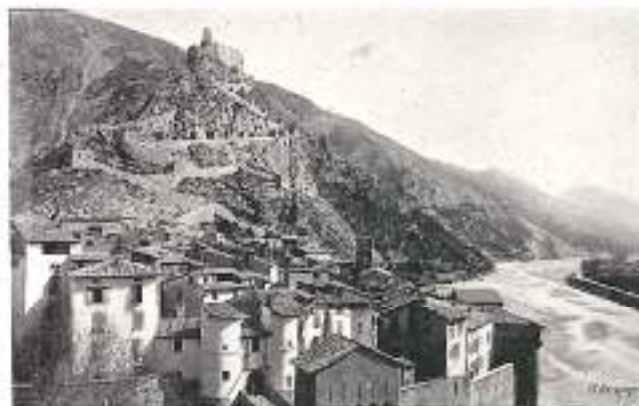
Entrevaux et le Var

SYNDICATS D'INITIATIVE. — Pour renseignements sur les hôtels, conditions de séjour, etc., s'adresser aux Syndicats du Briançonnais, du Queyras, de la vallée de l'Ubaye (à Barcelonnette), d'Annot, de Digne, de la Côte d'Azur (à Nice).