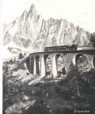
CHÉMIN DE FER DU MONTBLANC

De Chamoni , chemin de fer à crémaillère du Mont Blanc pour la