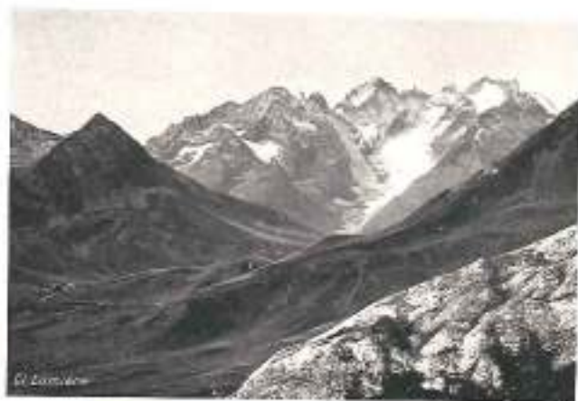
ROUTE DU GALIBIER

Briançon à Gap. — Simples promeneurs ou excursionnistes entraînés trouvent à y contenter leurs goûts, et ceux qui ne cherchent que l'air vivifiant de la montagne y rencontrent aussi d'excellentes villégiatures.