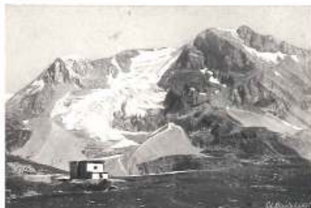
COL DE LA VANOISE ET GRANDE CASSE

Pralognan, centre important de tourisme et d'alpinisme (1425 m.), adossé au massif de la Vanoise : Col de la Vanoise (2527 m.), col de