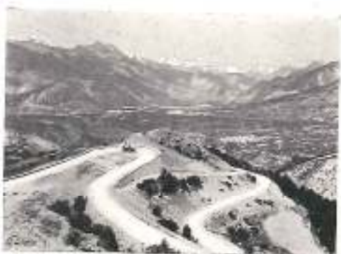
Lacs de Guillette

du trajet), puis par Mélieux, Saint-Paul-sur-Ubaye, la descente dans la vallée de l'Ubaye avec la vue du Brec de Chambeyron (3388 m.). La route franchit le Pas de la Reyssole, contourne les escarpements de Fort-Tourmoux, traverse Jausiers et arrive à Barcelonnette (service P. L. M. de correspondance par automobiles sur la gare de Prunières par la vallée de l'Ubaye — et service de correspondance par voitures sur Digne). Environs: Grande Siolane (2910 m.); Col de Larche (1995 m.), donnant accès en Italie; Col d'Allos (2250 m.); Chaîne du Parpaillon, etc.