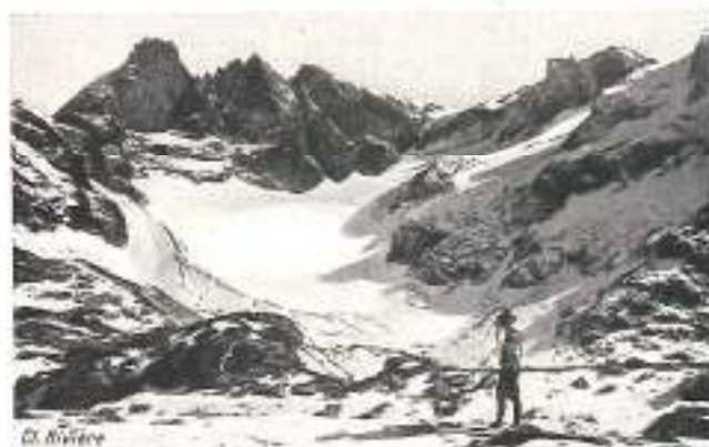
LES TROIS PICS DE BELLEDONNE

Allevard, station thermique et de séjour qui a donné son nom au massif qui l'entoure, est reliée par un tramway à vapeur à la station de Pontcharra-sur-Bréda (ligne de Grenoble à Chambéry). — Excursions : Brasse-Fartin, la Chartreuse de Saint-Hugon, le Grand-Collet (1924 m.), les Grands-Moulins (2497 m.), le Grand-Charnier (2564 m.), le Glayin (2789 m.), le Fay-Gots (2911 m.).