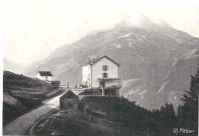
Le PRIEURÉ de SAINT-BERNARD sur la balivoère

Chaixière (2806 m.), Dôme de Chassefort (3597 m.), Grande Casse (3861 m.), etc. Nombreux passages sur les hautes vallées de l'Isère et de l'Arc.