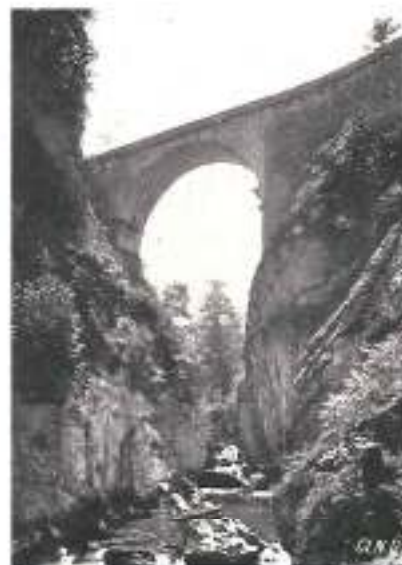
LE PONT SAINT-BRUNO

SYNDICATS D'INITIATIVE : Pour renseignements sur les hôtels, conditions de séjour, etc., s'adresser aux Syndicats de Grenoble et du Dauphiné, de St-Laurent-du-Pont , de St-Pierre-de-Chartreuse , de Voiron, de Charavines-les-Bains.