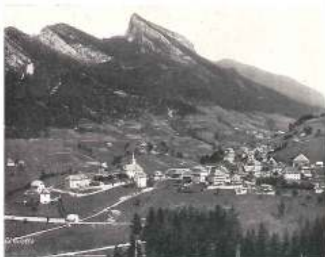
ST-PIERRE-DE CHARTREUSE et LE GRAND SOM