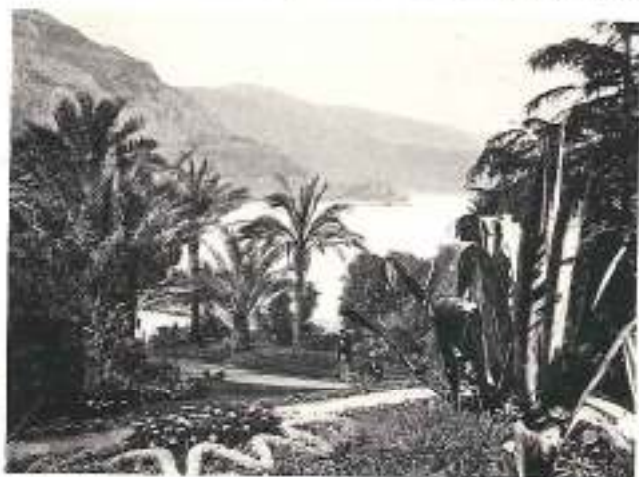
NICE — CANNES Les Jardins

L' Estérel , dont les roches de porphyre rouge, aux formes tourmentées, descendent jusqu'à la mer, est plus réclut, mais plus attrayant encore