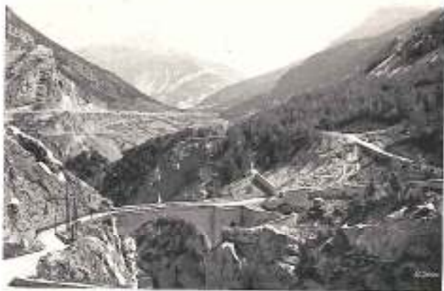
BRIANÇON Pont Astfeld et Col du Mont GENÈVE

SYNDICATS D'INITIATIVE. — Pour renseignements sur les hôtels, conditions de séjour, etc., s'adresser aux Syndicats : de Grenoble et du Dauphiné, d'Uriage-les-Bains, de Briançon, d'Allevard-les-Bains, de l'Oisans (à Bourg-d'Oisans), du Monestier-de-Clermont, du Trièves (à Mens), de Gap et des Alpes, du Briançonnais.