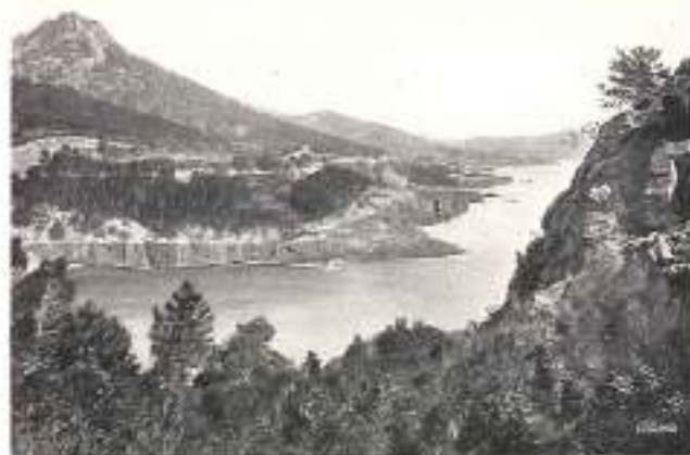
ESTÉREL Nouvelle Corniche

que le massif des Maures. Ses forêts de chênes-liège et de pins sont sillonnées de nombreuses routes parcourant des sites pittoresques (le Malinferrot , l' Auberge des Adrets , le Pigeonnier , etc.). De ses sommets ( Mont Vinaigre , 616 m.; Cap Roux , 453 m.), la vue s'étend superbe sur toute la Côte.