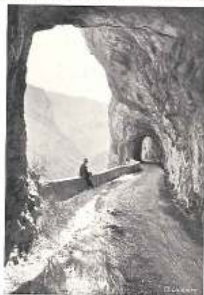
ROUTE 20 FRAO

3 o Service circulaire partant de Grenoble pour la Grande-Chartreuse et St-Pierre-de-Chartreuse par le Col de la Placette et