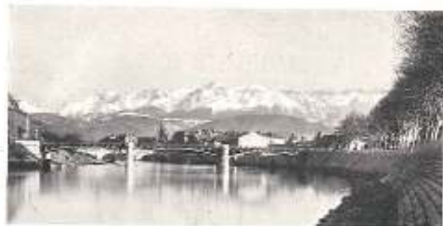
GRENOBLE La Chaîne de Belladonne et l'Isère

De riches alpages, des forêts séculaires qui dominent des escarpements sauvages, caractérisent l'ensemble du massif ; tout y paraît disposé pour le repos et le charme des yeux. De ses sommets ( Grand-Som , 2033 m., Dent de Crolles , 2066 m., Chamschaude , 2087 m.) facilement accessibles, la vue s'étend sur le splendide décor des Alpes.