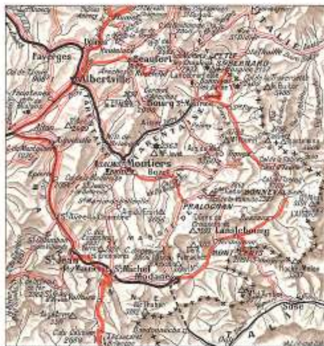
N.B. La ligne P. L. M. de Modane à St-Maurice doit ouvrir au cours de la saison d'été 1933.

La ligne de Maurienne remonte la vallée de l'Arc par Saint-Avre-la-Chambre (Col du Glandon); Saint-Jean-de-Maurienne (vallée des Arves, Aiguilles d'Arves, 3511 m.), point de départ du Sarotée P. L. M. de correspondance par auto-cars du Col du Galibier (partie de la Route des Alpes, voir p. 26);