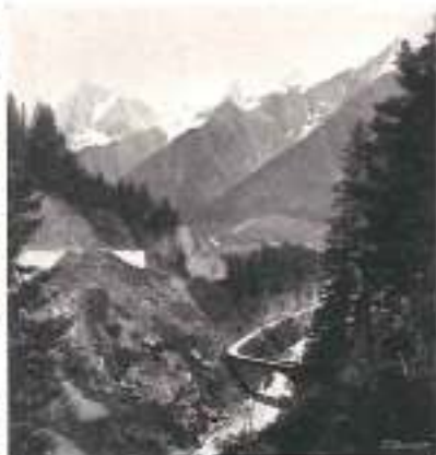
VALLÉE DE CHAMONIX Vidocq Sainte-Marie

SYNDICATS D'INITIATIVE : Pour renseignements sur les hôtels, conditions de séjour, etc., s'adresser aux Syndicats de Chamonix et de Saint-Gervais-les-Bains.