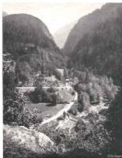
RECONSTRUIT DÉBIL D'ESTRETOCHES

Saint-Michel-de-Maurienne (Perron des Encombrés, 2828 m., Valloire, Col du Galibier, 2658 m.); Modane et la frontière d'Italie (Thabor 3182 m., Râteau d'Aussais 3126 m., Dent Parrachés 3712 m.). De Modane partent les Sarotées P. L. M. de correspondance par auto-cars du Mont Cenis (continuation sur Suse par les Services italiens) et de Bonnaival, centre d'alpinisme, d'où l'on accède au Col de l'Izran (2769 m.).