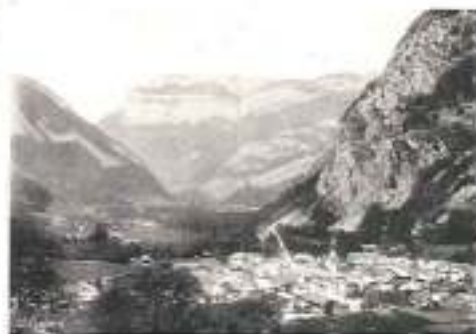
THÔNES ET LE PARMELAN

SYNDICATS D'INITIATIVE : Saint-Gervais-les-Bains , Thônes , Annecy , Chambéry .