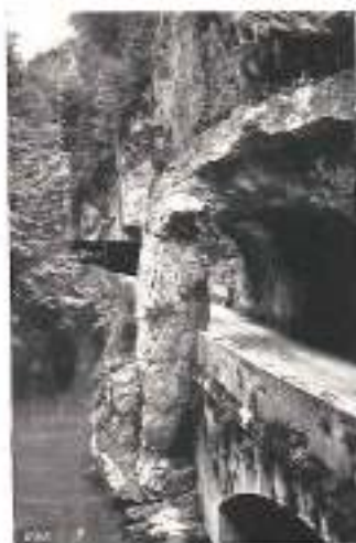
ROUTE DES GRANDS-GOULETS

SYNDICATS D'INITIATIVE : de Grenoble et du Dauphiné , de Valence-sur-Rhône et de la Drôme , de Die , du Villard-de-Lans , de Pont-en-Royans , des Grands-Goulets et de la Boorne , de Saint-Jean-en-Royans et de la Forêt de Lente , de Saint-Marcellin et de Visay .