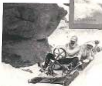
DESCENTE EN TOBOGGAN