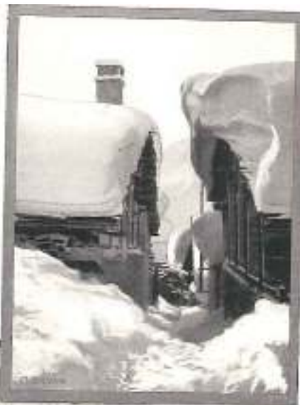
CHAMOUSSE Effet de neige

Enfin, nous citerons aussi les grands champs de ski de Briançon (Mont Genèvre), Modane et Lanslebourg,