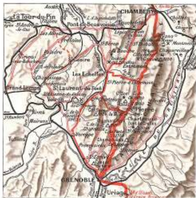
A. Laband lith.

Limité à l'est et au sud par le cours de l'Isère qui boigne ses falaises, le massif de la Chartreuse se déploie entre Chambéry et Grenoble et s'étend, à l'ouest, jusqu'aux Echelles.