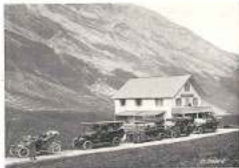
COL DES ARAVIS

d' Aix-Annecy (service circulaire d' Aix-les-Bains : aller par le Pont de l'Abîme et le Col de Leschaux , 904 m.; retour par les Gorges du Fier ).