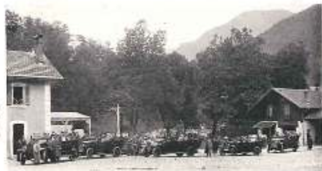
DÉPART 1929 CARRÉ-ALPES À LA GARE DE THONON

de la Suisse et de l'Europe centrale, on peut rejoindre les Alpes françaises par Genève et Martigny.