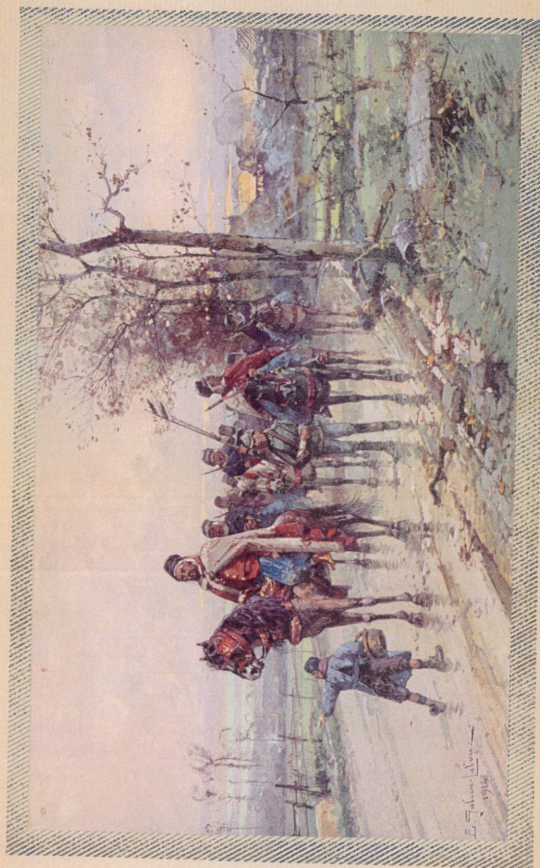
GOURMIERS RENTRANT DE RECONNAISSANCE

AIGUES-MORTES. — La « Ville des Croisades », au milieu des sables, dans un vrai décor d'Afrique ou d'Orient. Saint-Louis s'y embarqua en 1248 et en 1270, et y bâtit la Tour de Constance. La ville est aujourd'hui, par suite des atterrissements du Rhône, à 6 kilomètres de la mer à laquelle la relie le canal de la Roubine. Aigues-Mortes a conservé son cachet moyen âge. Ses remparts, admirable spécimen de l'architecture militaire du XIII e siècle, forment un quadrilatère presque rectangle de murs épais de 3 m. 50 flanqués de 15 tours hautes de 18 mètres, coupés de grandes portes entre deux tours rondes et de passages plus étroits sous une tour carrée, chaque ouverture correspondant à une rue.