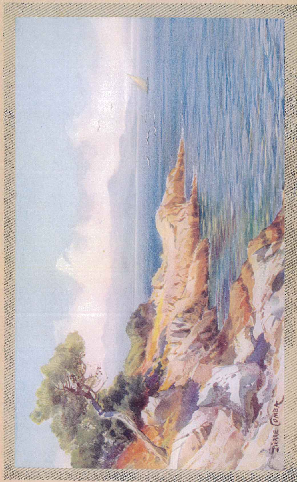
LITTORAL DE LA MÉDITERRANÉE — LE CAP MARTIN