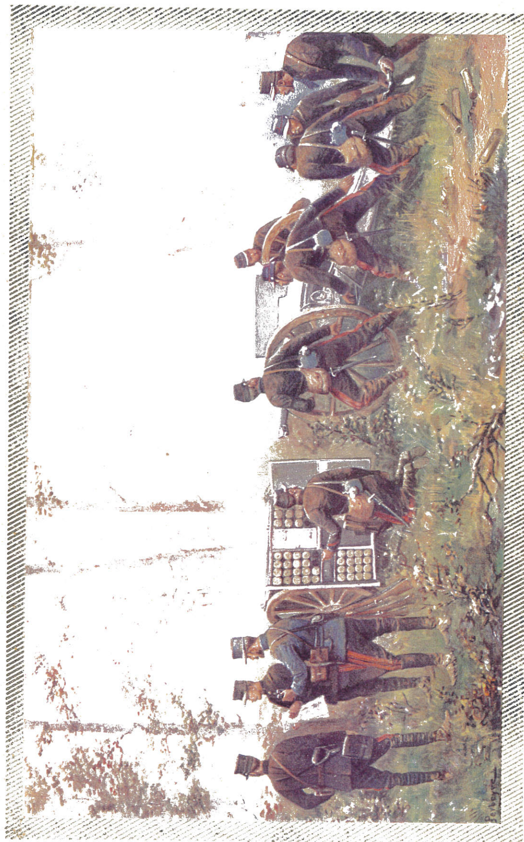
MISE EN BATTERIE DU 75