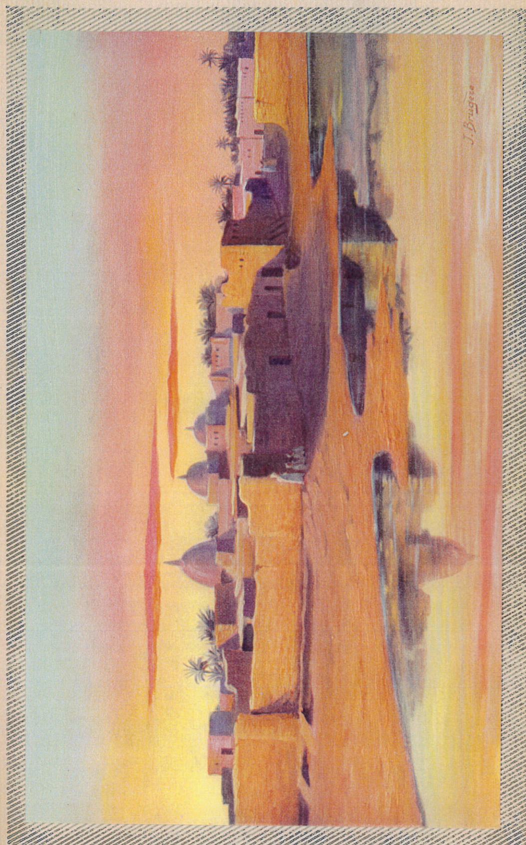
ALGÉRIE — ÉTANG DE TATAOUINE

Environs : Iles Kerkennah. — Gabès, son golfe et son oasis. — Les oasis de Gafsa et de Tozeur.