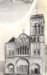
VÉZELAY. — La Basilique