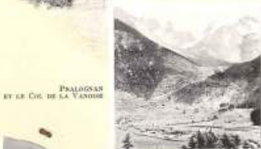
PRALOGNAN ET LE COL DE LA VANOISE