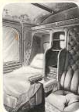
Lits-Salon à 3 places avec lits complets