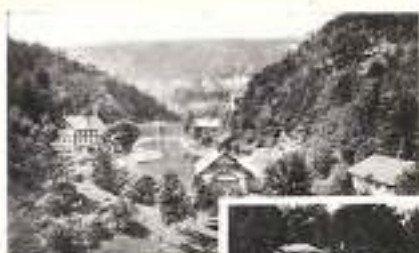
BAGNOLS DU DOUBS