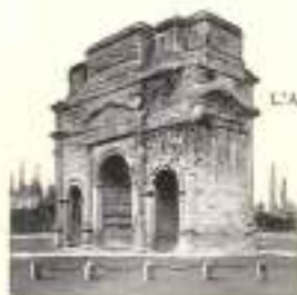
ORANGE L'Arc de Triomphe