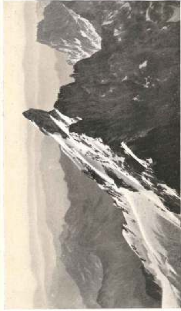
From Edward House.