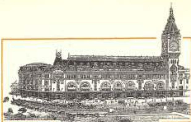
Gare de Paris P. L. M.

JURA SAVOIE DAUPHINÉ PROVENCE CÔTE D'AZUR CORSE VALLÉE DU RHÔNE BOURGOGNE NIVERNAIS AUVERGNE CÈVENNES