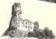
CHATEAU DE TOURNOËL