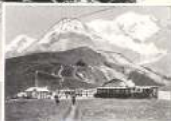
Col de Voza