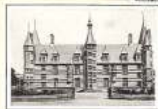
NEVERS — Calvaire des Ducs