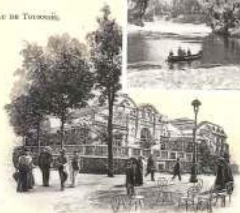
VICHY. — Le Casino