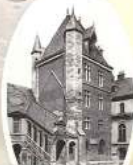
DIJON La Tour de Beurre