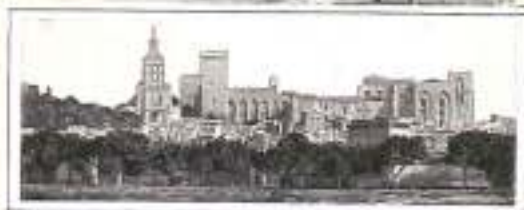
AVIGNON. — Palais des Papes