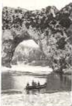
GORGES DE L'ARDECHE Pont d'Arc