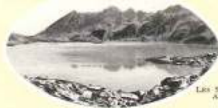
LES SEPT-LACS Allevard