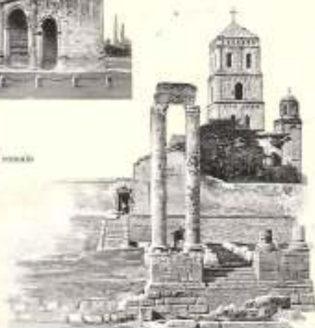
ARLES Restes du théâtre romain