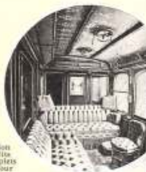
Salon à 3 lits complets le jour

VOIURE DE 1 re CLASSE AVEC COMPARTIMENT DE LUXE