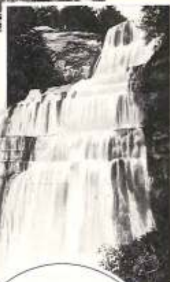
CASCADE DU HÉRISSEUX