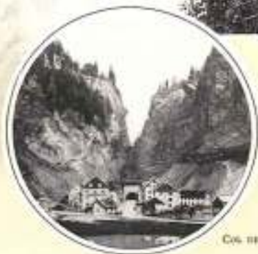
COL DES ROCHES