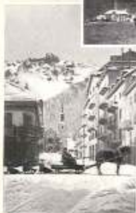
CHAMONIX à 1.700 m.