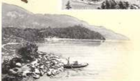
LAC DU BOURGET

Environs : Mer de Glace (chemin de fer à crémaillère du Montanvers; 1.921 m.), Glaciers des Bossons et d'Argentière. Les Aiguilles. Col de Balme. Le Brévent (2.525 m.). La Flégère (1.877 m.). Le Buet (3.109 m.). Servos et les gorges de la Diosas.