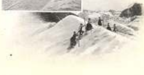
LA TIRÉ DE GLACE