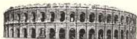
Nîmes — Les Arènes