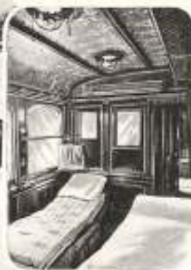
Salon à 3 lits complets la nuit