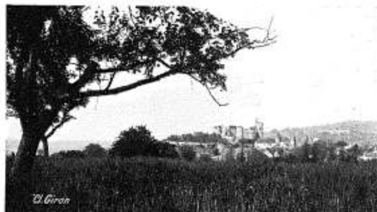
Environ de Vichy. Château de Billy

Entrepreneur : Société Anonyme des Transports Automobiles Industriels et Commerciaux, 24, rue de la Fédération, à Paris.