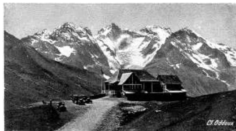
Chalet-Restaurant P. L. M. du Lautaret (2.108 m. d'alt.)

Au centre de cette admirable région, à Grenoble, déjà la montagne vous saisit et vous attire. De quelque côté qu'on se tourne, elle se montre aux regards; chaque rue offre une perspective sur les cimes environnantes; la chaîne de Belledonne avec sa ligne de sommets immaculés; le massif verdoyant de la Chartreuse, le haut plateau de Saint-Nizier, sentinelle du Vercors, entrecoupé de gorges profondes. Rarement, on rencontre un horizon comparable à celui-ci. Et c'est la raison pour laquelle, chaque jour, du centre même de la ville, de cette place Grenette, principal foyer d'animation, partent, dans toutes les directions, les autocars aux couleurs P. L. M. qui permettent de faire les plus belles excursions.