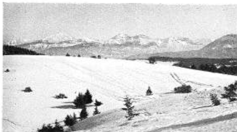
Plateau du Revard

NICE : Bureau de renseignements, Gare P. L. M. — DIGNE : Hôtel Rézouat, boulevard Gassendi. — GRENOBLE : Agence de renseignements P. L. M., 6, place Victor-Hugo et MM. Repelin et Traffort, 6, place Grenette. — SAINT-PIERRE-DE-CHARTREUSE : Hôtel du Grand Saas. — AIX-LES-BAINS : Comité d'initiative, place de l'Hôtel-de-Ville.