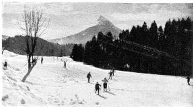
Environ de Saint-Pierre-de-Chartreuse

De Nice, par Puget-Théniers, Entrevaux, Digne, Sisteron, on atteint le col de Lus-la-Croix-Haute à 1.166 mètres, Monestier-de-Clermont, Grenoble, le col de Porte à 1.350 mètres, Saint-Pierre-de-Chartreuse, Saint-Laurent-du-Pont, Chambéry et, terme du voyage, Aix-les-Bains, à une heure du plateau du Revard d'où le panorama du Mont Blanc et de la chaîne des Alpes se découvre dans sa magnificence.