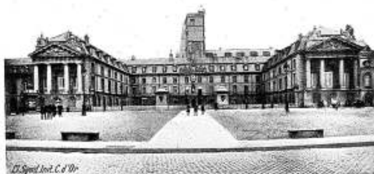
Dijon, Le Palais des Ducs

Circuit de la journée: Nord et Sud de la Forêt, avec arrêt à Barbizon pour le déjeuner: 20. 0