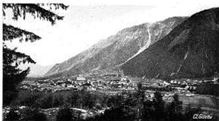
Chamonix - Mont Blanc

A peine a-t-on quitté l'élégante Riviera, qu'on s'enfonce dans d'âpres défilés de montagne. La citadelle d'Entrevaux commande un de ces étranglements à un coude du Var. Plus saisissantes sont les gorges de Daluis, taillées dans des rochers rougeâtres. Après le col de la Cayolle (2.352 m.), le cirque verdoyant de Barcelonnette s'élargit. Encore des gorges, encore des cols, jamais semblables. A la descente du col de Vars (2.115 m.), apparaît le massif resplendissant du Pelvoux. Le car reprend son ascension, traverse la riante vallée du Queyras, escalade les pentes figées de la Casse Déserte et franchit le col d'Izoard à 2.388 mètres. Briançon surgit, enserré dans ses fortifications; plus loin, plus haut, les prairies fleuries du Lautaret; l'autocar y dépose ses voyageurs au Chalet P. L. M., à 2.128 mètres d'altitude, pour leur permettre de déjeuner face à la Meije, dont les glaciers s'élèvent à 3.982 mètres.