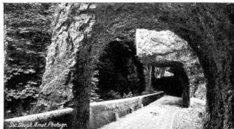
Les Grands Goulets

Quelles excursions?... Grande Chartreuse, ses forêts de sapins et son couvent désert; gorges de la Bourne dont les parois mesurent plus de 200 mètres de hauteur; défilé des Goulets où la route, creusée en plein roc, passe, tour à tour, de l'obscurité des tunnels à la lumière des corniches surplombant le ravin; plateau des Petites-Roches; Bourg-d'Oisans dans un cirque de verdure, La Grave au flanc de la montagne; alpages du Lautaret devant le massif de la Meije; paysage grandiose et sauvage de La Bérarde où la route, tracée dans un véritable chaos de rochers éboulés, domine de plusieurs centaines de mètres les eaux écumantes du Vénéon; circuit du Trièves qui révèle aux touristes le charme souriant des lacs de Laffrey; circuit des grands cols: Glandon (1.933 m.), Croix-de-Fer (2.062 m.), Galibier (2.550 m.), Lautaret (2.108 m.). Et combien d'autres excursions toutes plus belles, toutes plus tentantes.