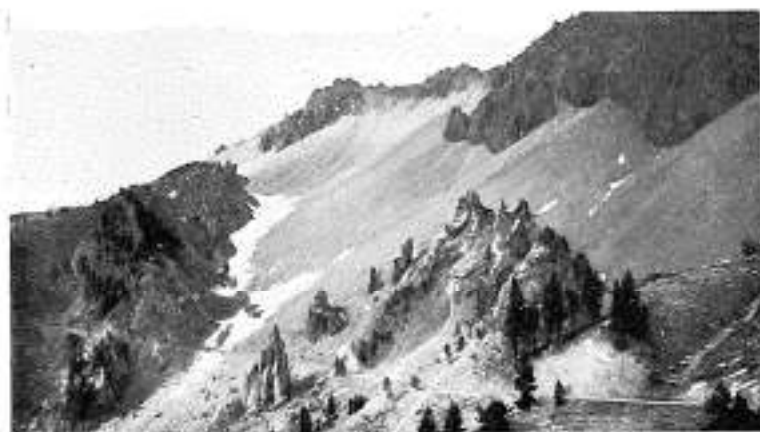
La Case Dierle

Au Lautaret, deux itinéraires s'offrent au choix des touristes. L'un franchit le col du Galibier (2.550 m.), traverse les gorges de l'Arly, Flumet et Mégeve. Une pointe à gauche sur Combloux et son hôtel P. L. M. dont les terrasses offrent un panorama splendide sur le Mont Blanc. Plus loin, sur la droite, Saint-Gervais, puis enfin Chamonix, grande station estivale et capitale des sports d'hiver. Le deuxième itinéraire descend sur La Grave et Bourg-d'Oisans, passe au pied du château de Vizille, traverse Uriage et parvient à Grenoble. Il monte ensuite au col de Porte, à 1.350 mètres, traverse la Grande Chartreuse, Chambéry et Aix-les-Bains à une heure, en chemin de fer à crémaillère, du plateau du Revard (Hôtel P. L. M. à 1.545 m.). Plus loin, Annecy et son lac, le col des Aravis, Combloux et Chamonix. Par le col des Gets et les gorges de la Dranse, on atteint Thonon et, enfin, Evian, la ville d'eaux célèbre.