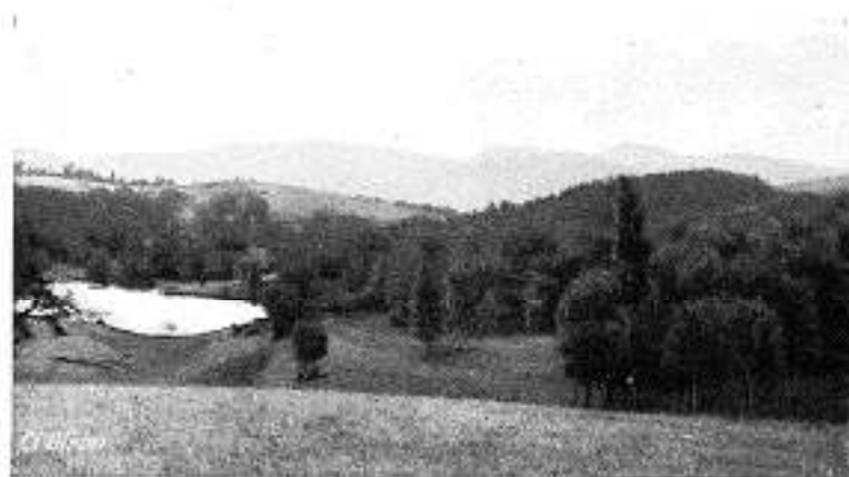
Environ de Thiers. Masif du Montroc

Un chaos de montagnes et de dômes de toutes altitudes ; des coulées basaltiques, des gorges sauvages, des cratères de volcans transformés en lacs aux eaux profondes : Pavin, Chambon, Issarlès, Tazenat ; des plaines magnifiques ; des ruines féodales : châteaux de Tournoiël, de Murois, de Polignac ; des villes d'art comme Le Puy, véritable musée en plein air ; des églises romanes : La Chaise-Dieu, Clermont, Issoire, Saint-Nectaire, Orcival ; des stations climatiques : Besse, Murois, Saint-Agrève ; tout un chapelet de villes d'eaux : Vichy, Châtelguyon, Royat, Saint-Nectaire, La Bourboule, le Mont-Dore, Vals-les-Bains, à la fois stations de cure thermique et centres d'excursions d'où, pendant la saison d'été, partent, dans toutes les directions, des Services automobiles P.L.M. qui permettent aux touristes d'admirer toutes les curiosités que renferme cette belle région.