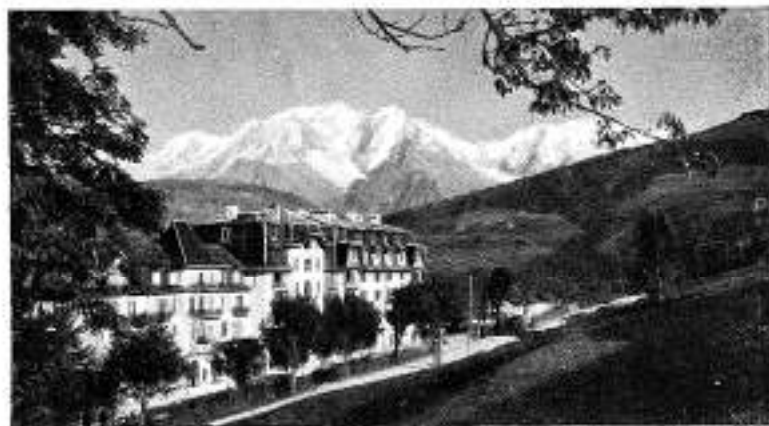
Combloux - Grand Hôtel P.L.M. du Mont Blanc (1.600 m. d'alt.)

Pour visiter cette belle région, point n'est besoin de mettre sac au dos. Si le chemin de fer ne peut mener sur les plateaux élevés, le funiculaire et, plus souvent, l'autocar y conduisent sans fatigue à travers des sites d'autant plus imposants qu'on s'élève davantage.