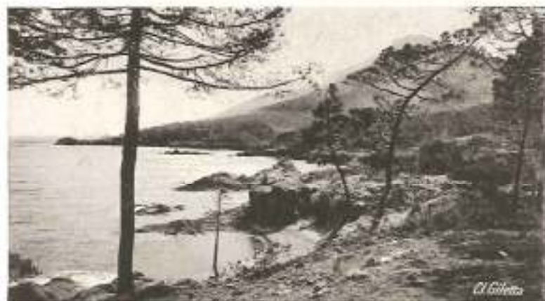
Route de l'Estérel

La Route du Littoral suit les déchiquetures de la rive, depuis Marseille jusqu'à Menton. Elle montre la Côte d'Azur sous ses aspects les plus divers : Cassis aux calanques secrètes, La Ciotat derrière le Bec de l'Aigle, les Lecques, Bandol, Sanary, Ollioules dont les gorges sont fameuses; Toulon, sa darse et ses faubourgs; Hyères dans les palmiers; Bormes fleurie de mimosas; les stations reposantes des Maures : Le Lavandou, Cavalière, Cavalaire, Pardigon, La Croix, Sainte-Maxime, Saint-Aygulf; Fréjus fière de ses ruines romaines. Au delà de St-Raphaël et de Boulouris adossés aux premières pentes de l'Estérel, commence la Corniche d'Or où le rouge violent de la roche, la verdure des pins, le bleu intense de la mer présentent de saisissants contrastes. Après Agay, Le Trayas, Théoule et La Napoule, les célèbres stations mondaines se succèdent: Cannes, Nice, Monte-Carlo, Menton, où tout est beauté, luxe, élégance.