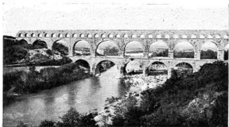
Le Pont du Gard

Par la pureté de son ciel et la beauté de son sol, par la masse imposante de ses monuments antiques, dont beaucoup sont encore dans un parfait état de conservation, la Provence se recommande à l'attention du touriste. Ici, le voyage est un véritable cours d'histoire; nulle part ailleurs on ne rencontre autant de vestiges du passé. Les Romains, grands constructeurs, ont élevé dans les cités d'Arles, d'Orange, de Nîmes, de Vaison, des monuments qui peuvent être considérés comme les plus beaux qui soient sur le sol de la Gaule. Temples, théâtres, cirques, aqueducs, arcs de triomphe de l'époque romaine voisinent en Provence avec les basiliques, les chapelles, les mausolées, les châteaux forts et les remparts du moyen âge. A Avignon et à Aigues-Mortes, l'art médiéval éclate dans toute sa splendeur. Et voici, à deux heures d'autocar de Nîmes, le Musée du Désert où sont conservées les reliques de l'Église réformée.