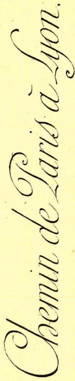
Tableau indiquant, par jour, le mouvement des trains spéciale et leur influence sur le service ordinaire.