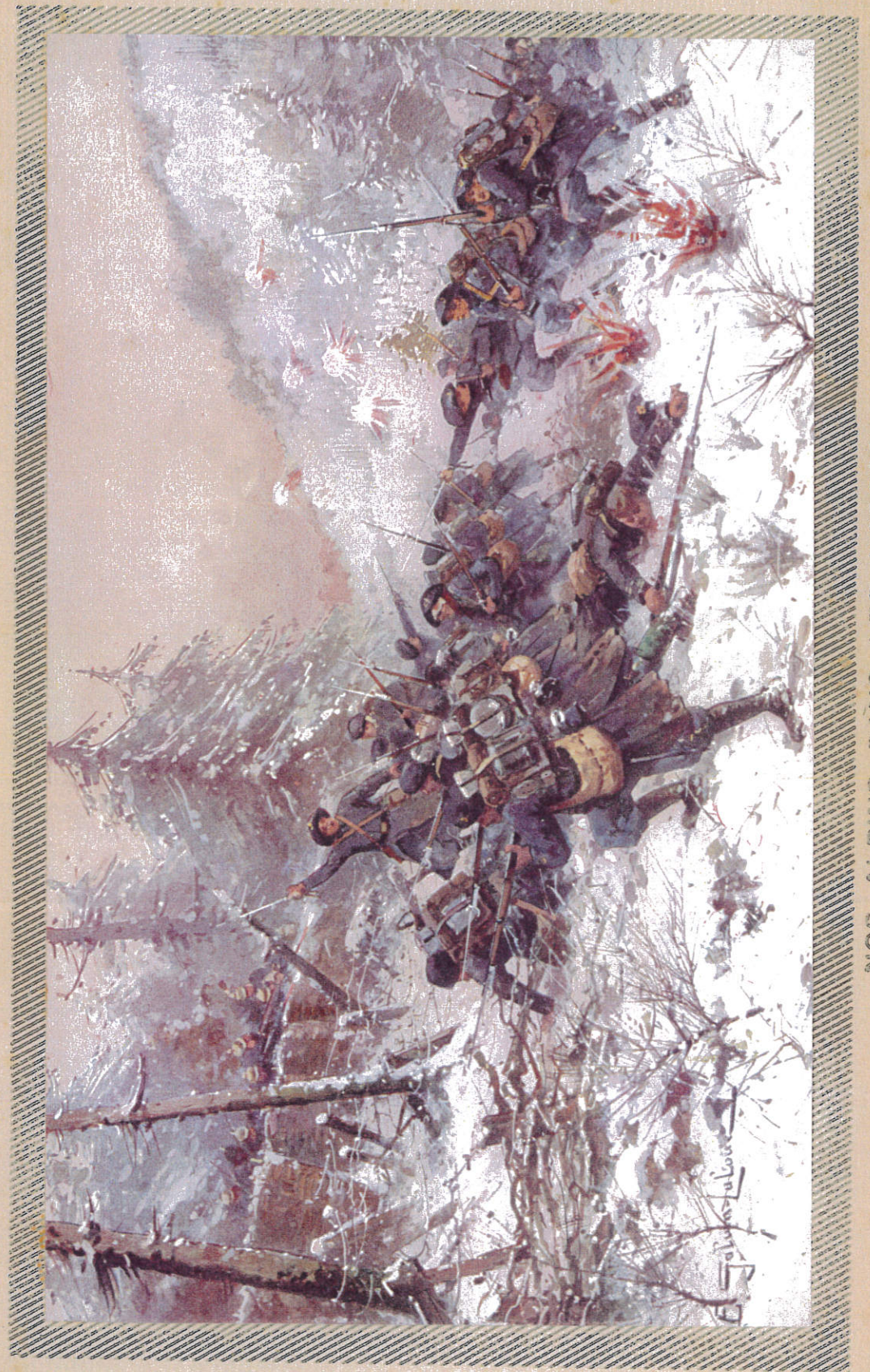
NOS ALPINS DANS LES VOSGES