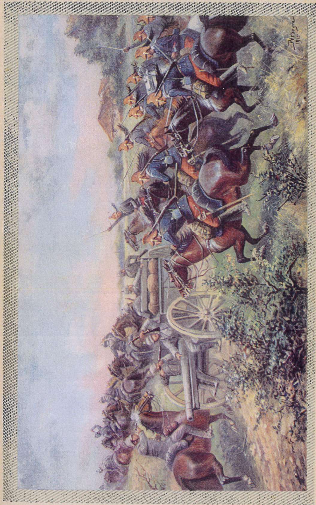
PRISE D'UNE BATTERIE ALLEMANDE