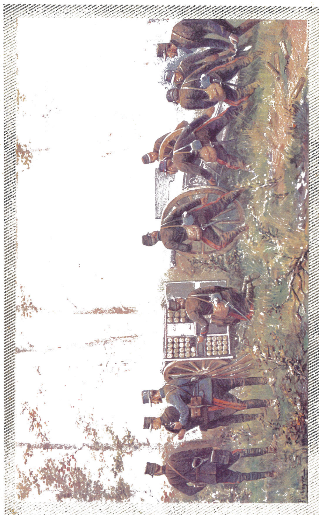
MISE EN BATTERIE DU 75