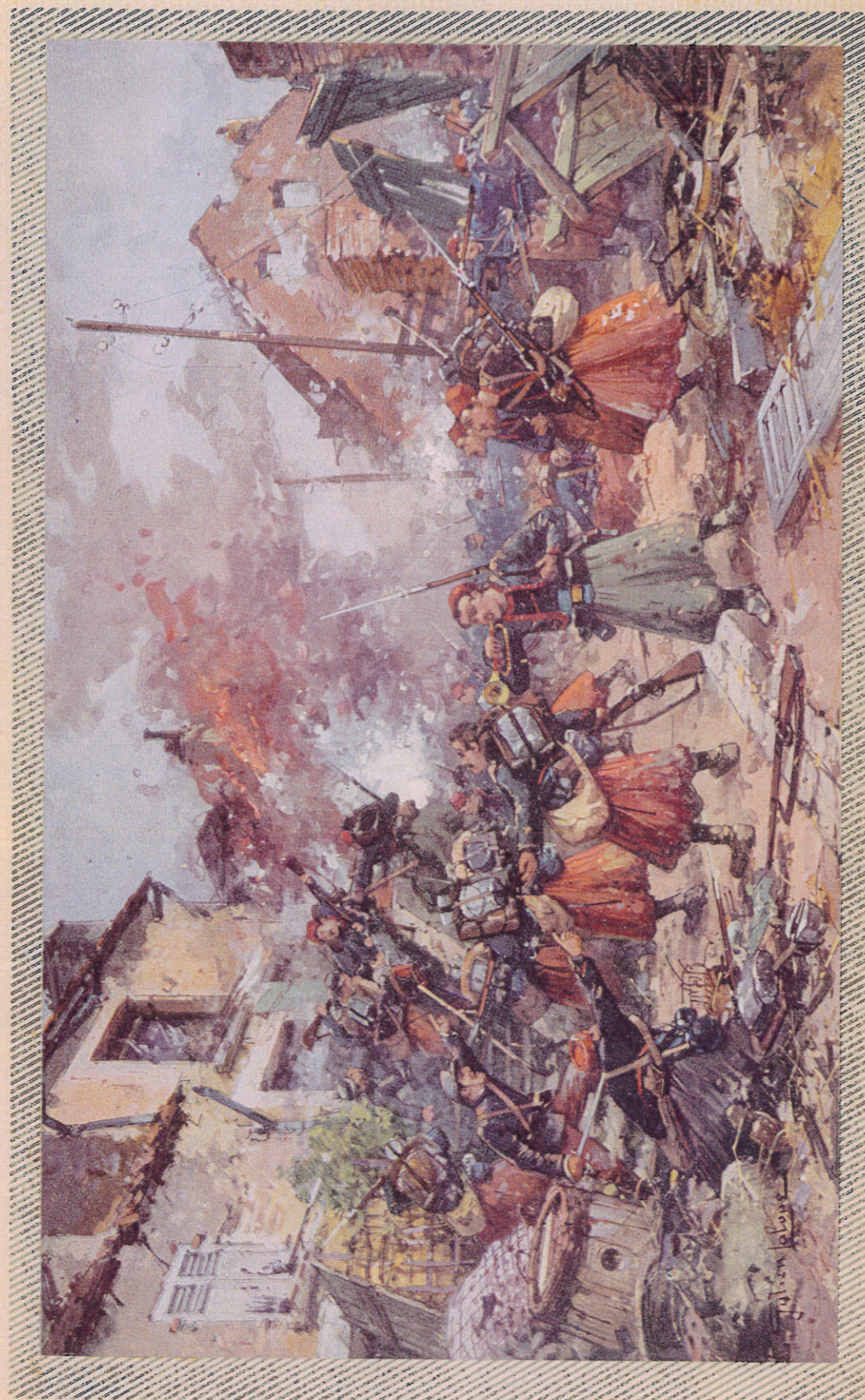
PRISE D'UN VILLAGE