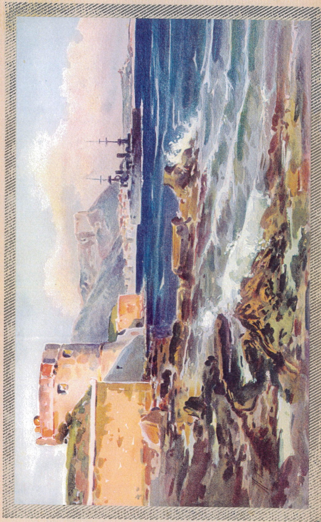
TOULON — LA RADE