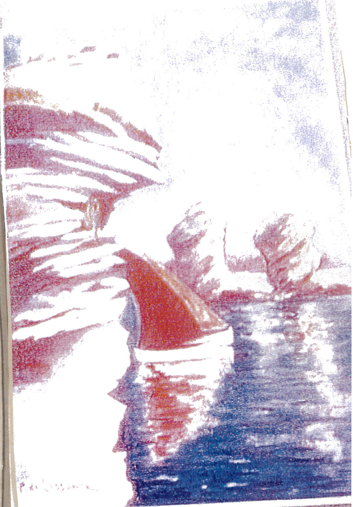
CORSE, FALAISES DE BONIFACIO PAR PAUL DE LARDENS